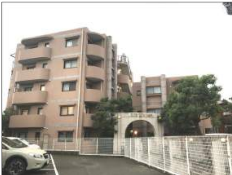
<当マンション外観写真>

●神戸市長田区宮川町2丁目●市営地下鉄線「長田」駅より徒歩約7分●鉄筋コンクリート造陸屋根5階建●土地権利／所有権●宅地●種類／居宅●管理費／月額8,250円●修繕積立金／月額10,990円●自治会費／月額200円●駐車場／無し●築年月／平成7年2月●現況／空家●引渡日／即日可能●取引態様／仲介